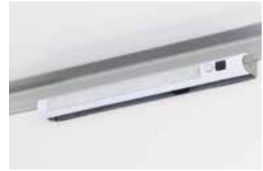
Neue, autarke und flexibel platzierbare LED-Innenleuchte