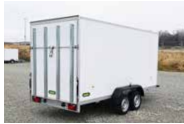
Glatte Außenwand ohne Stoß für preiswerte Beschriftung