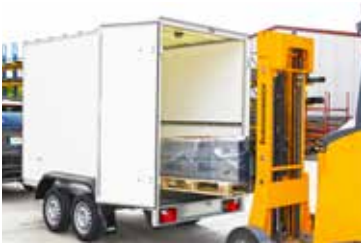
Mehr Nutzlast durch geringes Eigengewicht